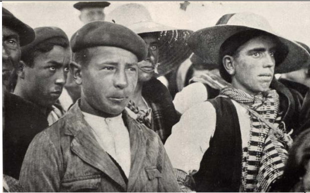
Público nunha Misión Pedagóxica en Torrecaballeros (Segovia) o día 5 de xullo de 1933, probablemente asistindo a una sesión de teatro ao aire libre. Os dous mozos de sombreiro son segadores galegos.