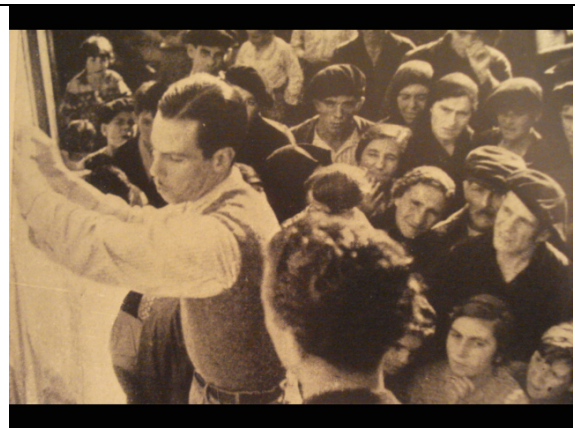
Ramón Gaya colga en Malpica un debuxo seu, posiblemente para facer as “aleluías” dun canto de cego que representaron nesta ocasión. Outubro de 1933.