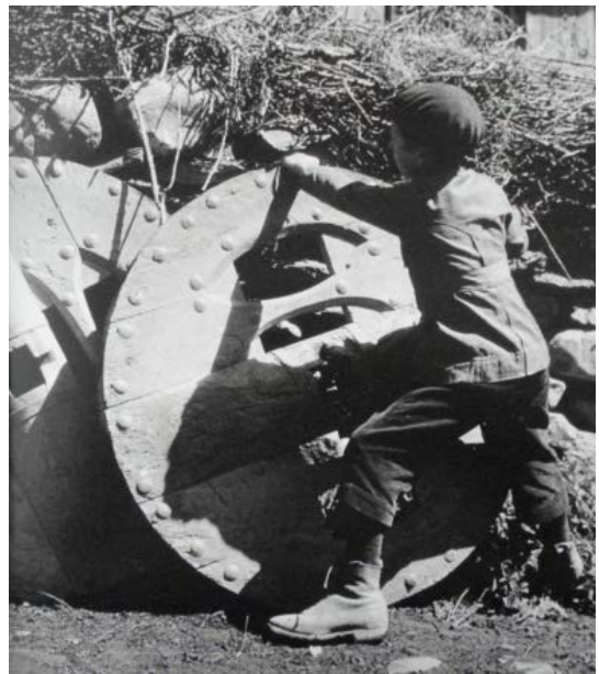
Neno de La Baña (León) xogando cunha roda