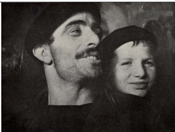
O “Tío Graña”, un coñecido mariñeiro de Malpica, e o seu fillo, no museo de pintura das Misións Pedagóxicas o 20 de outubro de 1933