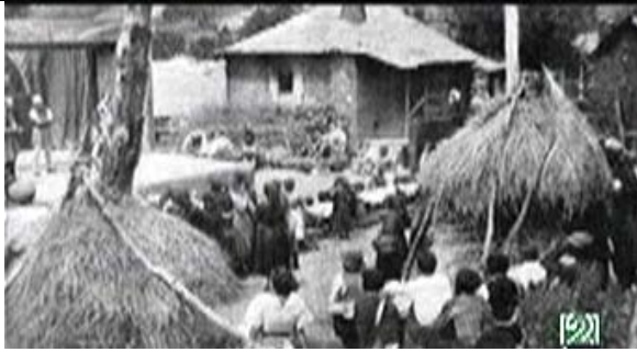
Arriba, representación do Teatro en Galende (Zamora). Abaixo un dos marcapáxinas que se levaban coas bibliotecas.