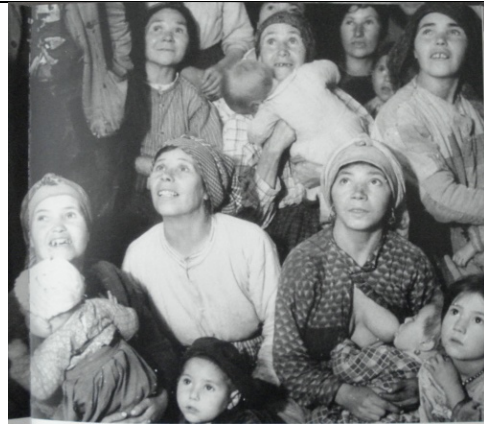
Vendo unha película por primeira vez

Hablamos de muy distintas cosas, y en la manera respetuosa y nada disparatada que tenían para aludir a temas políticos, comprendimos que entre el zapatero o el portero de una gran ciudad y estos hombres descalzos existe un abismo de finura, de elegancia auténtica, de pureza (a favor de los descalzos, naturalmente), que no es fácil suponer desde lejos. (Ramón Gaya Memoria 1934, pág. 114)